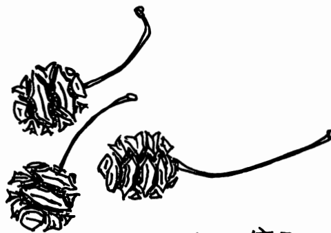
メタセコイヤの種子